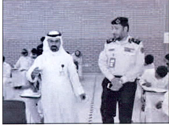
• اللواء خالد التركيت أثناء الجولة

التطبيقي والتدريب وان الاختبارات ميسرة وعملية تصحيحها ورصد نتائجها تتم بشكل الي . وختم اللواء خالد التركيت جولته التفقدية بالشكر للجان والعاملين في مركز إعداد رجال الإطفاء وكذلك شكر الهيئة العامة للتعليم التطبيقي والتدريب على الجهود المبدولة في جميع دورات الإطفاء. متمنيا للمتقدمين التوفيق والنجاح.