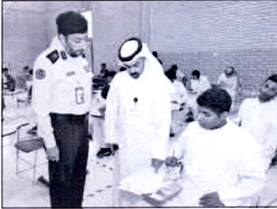
• ... ويطلعون على سير الاختبارات