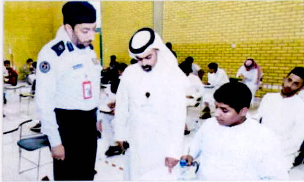
■ اللواء خالد التركيت متفقدًا اختبارات الضباط